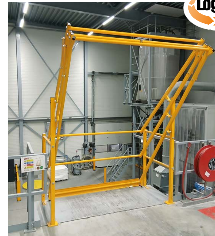
Een grondige visuele inspectie kan het verschil maken om de effectiviteit en betrouwbaarheid te waarborgen.