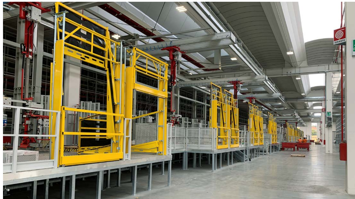
'We merken dat steeds meer bedrijven hun magazijnen automatiseren en het aantal grote projecten neemt toe.'