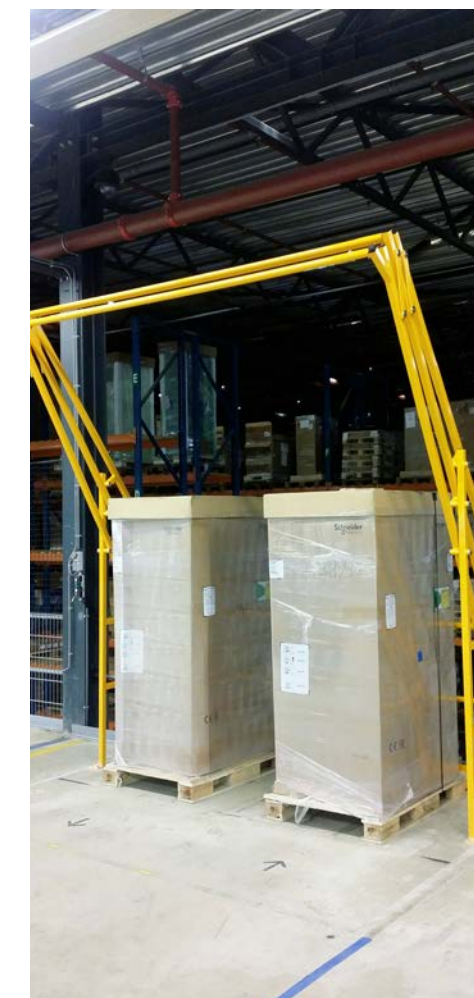
De Variogate 28 is geschikt voor pallets van 2,80 meter hoog.

Op LogiMAT is Haagh Protection in Hal 5 - Stand 5B54 te vinden. ■