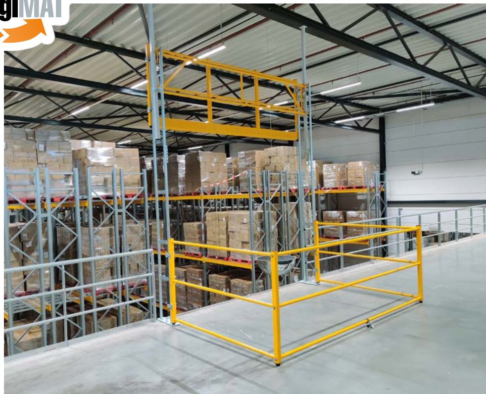
Een Variogate op maat gemaakt.